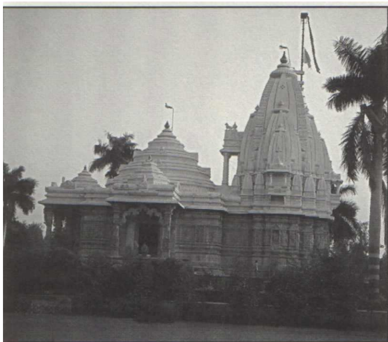
Il Tempio di Kayavarohana in Gujarat