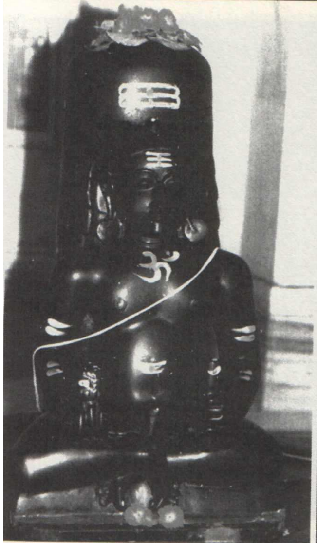
La statua del Signore Brahmeshvara (Dadaji) nel tempio di Kayavarohana