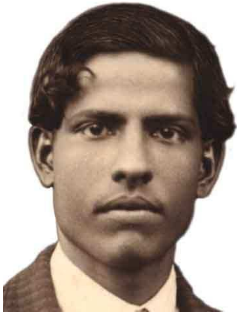
Bapuji da giovane